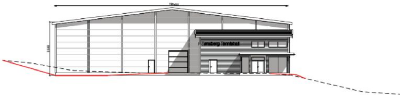
1:250 Fasade Sør